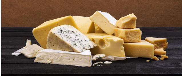
Tamales y queso.